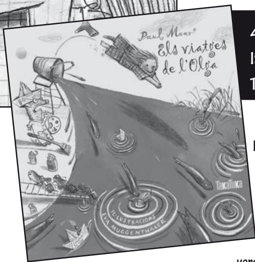
ilustración: Eva Muggenthaler